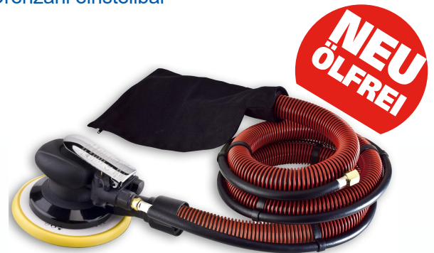
RRI-5125-2SV / RRI-6150-2SV RRI-5125-5SV / RRI-6150-5SV