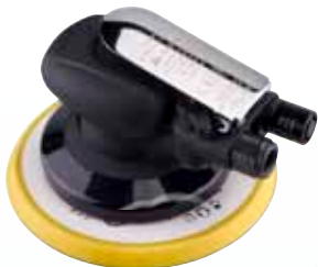
RRI-5125-2NV / RRI-6150-2NV RRI-5125-5NV / RRI-6150-5NV