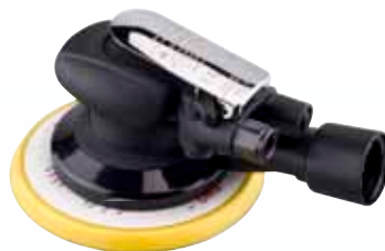
RRI-5125-2CV / RRI-6150-2CV RRI-5125-5CV / RRI-6150-5CV