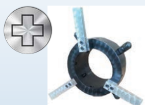
Spezialwerkzeug zum Anfasen von Rohrbögen