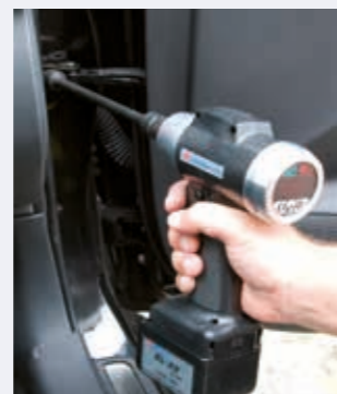
YBX-600TE in Betrieb