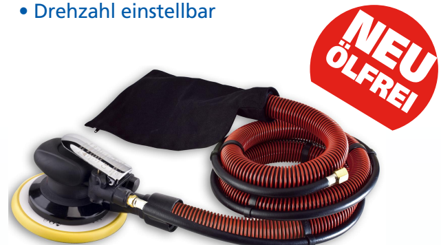
RRI-5125-2SV / RRI-6150-2SV RRI-5125-5SV / RRI-6150-5SV