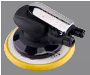
RRI-5125-2NV / RRI-6150-2NV RRI-5125-5NV / RRI-6150-5NV