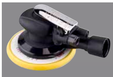
RRI-5125-2CV / RRI-6150-2CV RRI-5125-5CV / RRI-6150-5CV