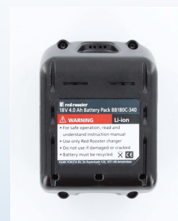
Batterie 4,0 Ah: TTBB180C-340