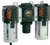
Filter, Regler, Öler Das Gesamtsortiment finden Sie in unserem Zubehörcatalog.