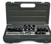
SK4M18 81287385 Steckschlüssel-Satz 1/2", 18 Stück (10, 11, 13, 14, 17, 19, 21, 22, 24, 13L, 14L, 21L, 24L, 17L, 19L und 21L mm, Verlängerung 125 mm)