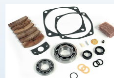
2235-TK1 47517401001 Schlagschrauber-Motor-Reparatur-Set