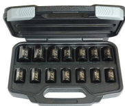
SK4M14 81287351 Steckschlüssel-Satz 1/2", 14 Stück (10, 11, 12, 13, 14, 15, 16, 17, 18, 19, 21, 22, 23 und 24 mm)