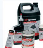
Schmiermittel Das Gesamtsortiment finden Sie in unserem Zubehörcatalog.