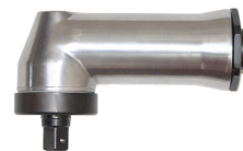
4UA9 03070216 1/2" Winkelkopf (Drehzahlreduzierung: 25%, Drehmomentreduzierung: mehr als 50%)