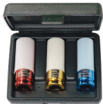
SK4M3L 81287377 Steckschlüssel-Satz 1/2", 3 Stück (17, 19 und 21 mm)