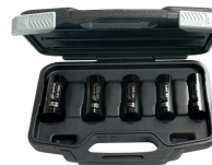
SK4M5L 81287369 Steckschlüssel-Satz 1/2", 5 Stück (17, 19, 21, 22 und 24 mm)