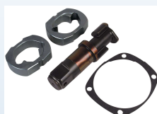
2235-THK1 47517319001 Schlagschrauber-Hemmer-Reparatur-Set